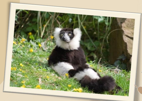
Planche de classification des primates, empreintes, nourrissage des varis noirs et blancs.